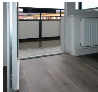
Bild links: Bodengleiche Klappduschen schaffen Platz, hohe Duscheinsteige gibt es nicht mehr. Bild rechts: Die 20 cm hohen Balkonschwellen werden abgesenkt, der Zugang zum Balkon ist somit barrierearm zu bewältigen.